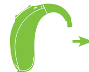
Naída Link M hoortoestel

Mensen die nog enig gehoor hebben in het ene oor, kunnen met het juiste hoortoestel zelfs beter horen dan met alleen een cochleair implantaat. Als u zowel een Naída Link M als een Naída CI M draagt, ervaart u een consistent geluid in beide oren en zijn beide apparaten met één druk op de knop te bedienen.