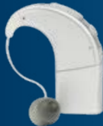
Naída CI-spraakprocessor met EAS