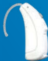
Naída Link CROS