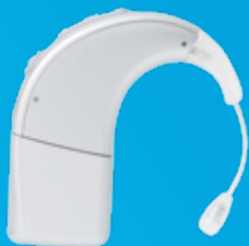
Processeur de son Naída CI

La solution bimodale Naída Link vous permet d'entendre plus aisément et plus confortablement tout au long de la journée, en faisant appel à la même technologie automatique afin de réagir et de s'ajuster simultanément et de la même manière aux situations auditives changeantes.