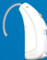
Naída Link CROS