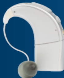
Processeur de son Naída CI avec EAS