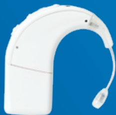
Processeur de son Naída CI

Les situations bruyantes sont encore plus difficiles à aborder avec une audition limitée à une seule oreille. Mais avec la solution Naída Link CROS, vous pouvez profiter des microphones sur chaque oreille pour vous concentrer sur la personne en face de vous et ignorer les sons indésirables qui vous entourent.