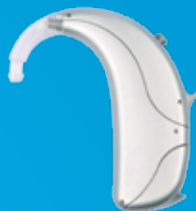
Aide auditive Naída Link