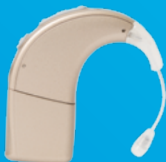
Processeur de son Naída CI

Les processeurs de son Naída CI sont programmés pour être utilisables sur n'importe quelle oreille au lieu d'être spécifiquement associés au côté gauche ou au côté droit.