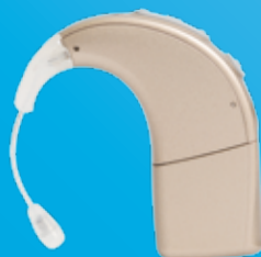
Processeur de son Naída CI