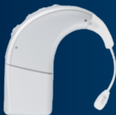
Processeur de son Naída CI

Avec le processeur de son Naída CI Q90 et sa capacité électrique acoustique intégrée, vous bénéficiez du meilleur des deux mondes. Cette solution auditive intégrée est dotée de la technologie d'aide auditive Phonak dans le processeur de son Naída CI. Vous pouvez ainsi profiter de la qualité sonore plus pleine et riche d'une aide auditive dans votre oreille implantée.